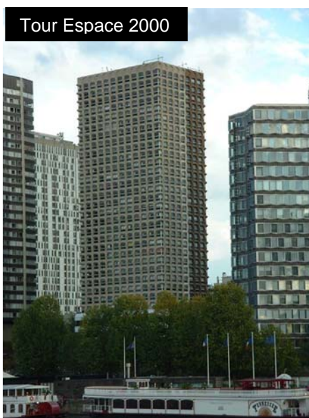
Tour Espace 2000

Le tout a commencé par la rénovation de la Tour Espace 2000 , située dans le XV ème arrondissement, pour le compte de Foncia. Il s'agissait là d'un gratte-ciel résidentiel, construit en 1976, en Front-de-Seine.